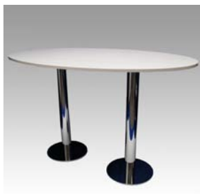
29440 Stehtisch Upright table