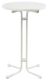
29010 Stehtisch Upright table