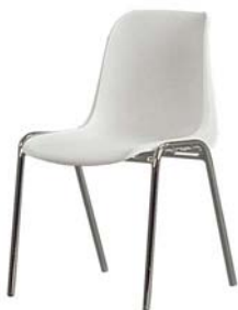
10101 Schalenstuhl Plastic chair