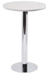
29400 Stehtisch Upright table