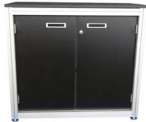
50018 Sideboard Sideboard