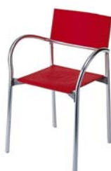
12544 Breeze, rot Breeze, red