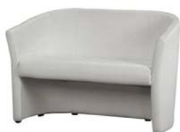
15011 Clubsofa Club sofa