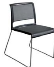
12539 Alina Alina