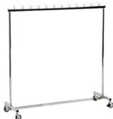
30005 Konfektionsständer Coat rack