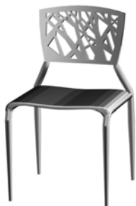
12051 Viento, grau Viento, grey