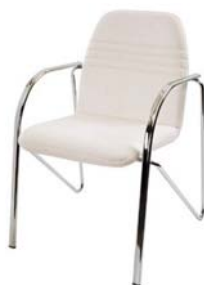
15604 Konferenzsessel Conference Armchair