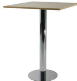
29083 Stehtisch Upright table