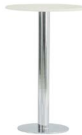
29080 Stehtisch Upright table