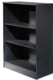
50207 Aktenregal, niedrig Shelving, low