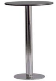
29090 Stehtisch Upright table