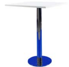
29086 Stehtisch Upright table