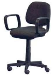
14010 Drehsessel Revolving chair