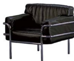
15400 Sessel Zarutti Armchair Zarutti