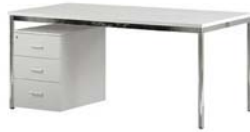
21110 Schreibtisch Desk