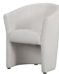
15100 Clubsessel Club armchair