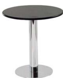
26010 Bistrotisch Bistro table