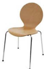
12030 Balloon, Buche Balloon, beech