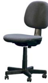
14000 Drehstuhl Revolving chair