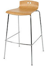
16010 Barhocker Shaker Bar stool Shaker