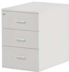
50050 Rollcontainer Container removable