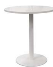
25000 Bistrotisch Bistro table