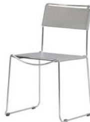
13201 Trav, grau Trav, grey