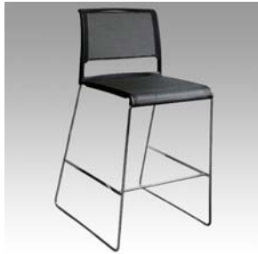
16625 Barhocker Aline Bar stool Aline