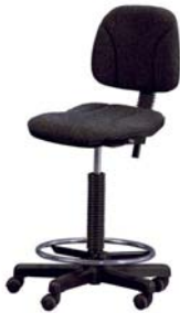
14100 Counterstuhl Counter chair