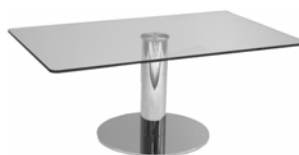
27053 Couchtisch, Glas Couch table, glass