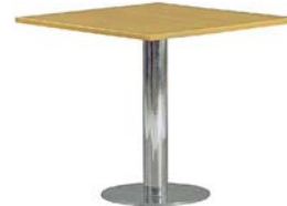
22210 Bistrotisch Bistro table