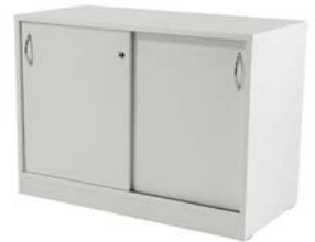
50045 Sideboard Sideboard