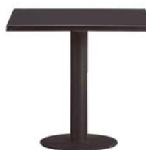
21004 Bistrotisch Bistro table