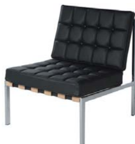
15210 Sessel Coupé Armchair Coupé