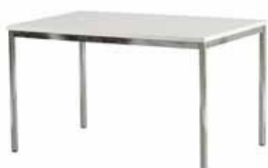
21021 Besprechungstisch Conference table