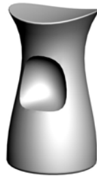
16651 Barhocker Skoop Bar stool Skoop