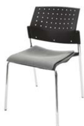
15605 Konferenzstuhl Conference chair