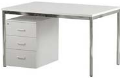
21100 Schreibtisch Desk