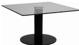
27065 Couchtisch, Glas Couch table, glass