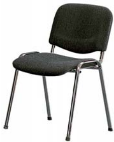
10200 Objektstuhl Upright chair