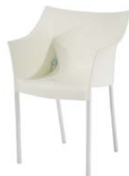
12565 Dr. No (Kunststoff) Dr. No (plastic)