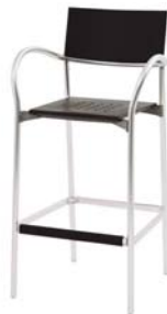
16630 Barhocker Breeze Bar stool Breeze