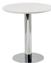
26000 Bistrotisch, Bistro table