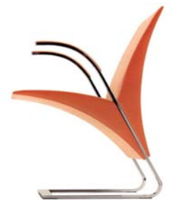
15410 Sessel Ravello Armchair Ravello