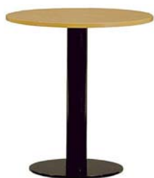
25151 Bistrotisch Bistro table