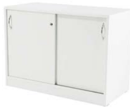
50044 Sideboard Sideboard