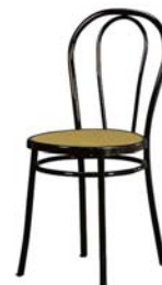
11040 Bistrotstuhl, sw Bistro table, black