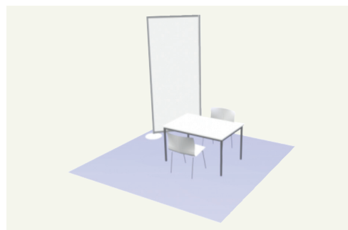
Table Top Angebot*/ Table Top offer*

Preis/price: 600,- € zzgl. USt., AUMA-Gebühr, Stromkostenpauschale, Mediapackage) (+VAT, AUMA-fee, Energy flatrate, Media Package) * nur für Firmen, die nicht älter als drei Jahre sind sowie für wissenschaftliche Projekte * only for companies, which are less than three years old as well as for scientific projects